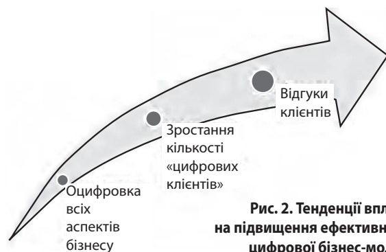
Рис. 2. Тенденції впливу на підвищення ефективності цифрової бізнес-моделі

Три тенденції впливають на підвищення ефективності цифрової бізнес-моделі підприємства (рис 2). Першою з них є продовження роботи над оцифровкою всіх аспектів бізнесу, що сприятиме задоволенню більшого числа вимог клієнтів, покращенню продуктивності ваших бізнес-процесів та ефективній роботі разом з партнерами у ланцюжку створення вартості.