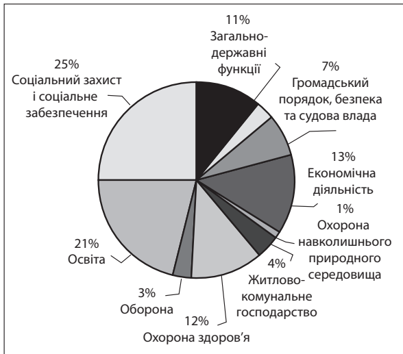
Рис. 2. Розподіл видатків за напрямками діяльності в Україні у 2012 рік

* Складено на основі даних Державного Комітету Статистики України // www.ukrstat.gov.ua