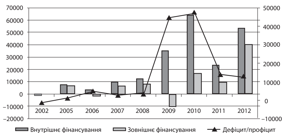
Рис. 1. Структура фінансування державного бюджету України

* Складено на основі даних Державного Комітету Статистики України // www.ukrstat.gov.ua