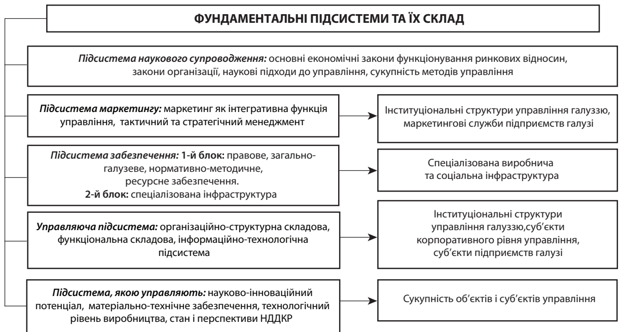
Рис. 1. Склад фундаментальних підсистем загальної системи формування конкурентоспроможності галузі (узгальноно авторами на основі [1 – 6])