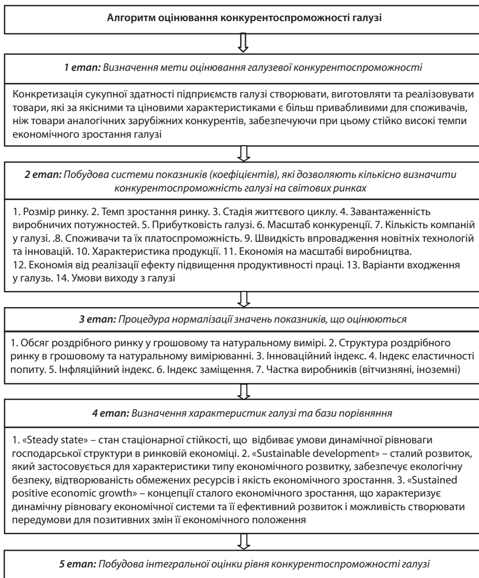
Рис. 2. Етапи оцінювання конкурентоспроможності галузі та їх сутність (авторська розробка)