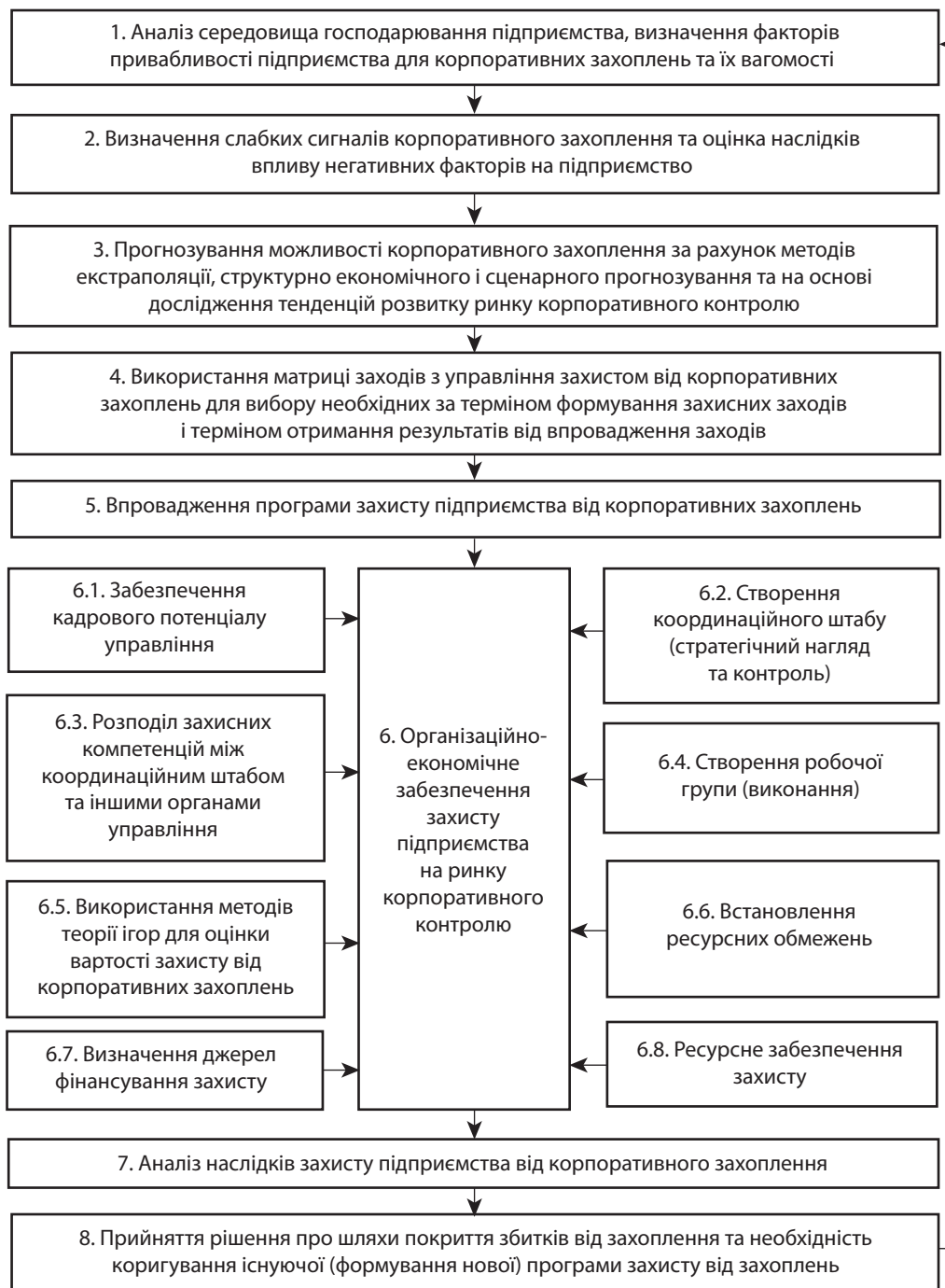
Рис. 3. Модель організаційно-економічного забезпечення захисту підприємства на ринку корпоративного контролю