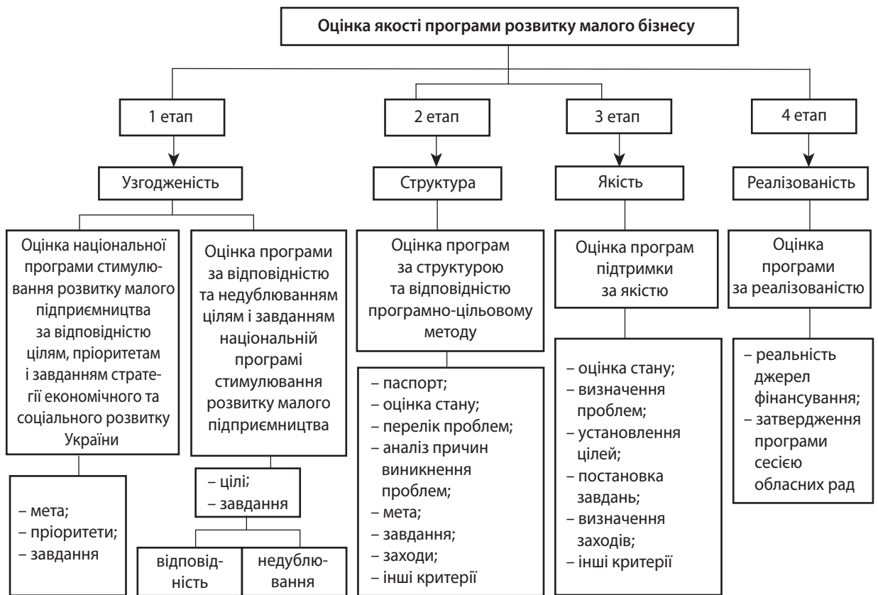
Рис. 2. Схема оцінки якості цільових програм державної підтримки розвитку малого бізнесу [7]

Розглянутий методичний підхід до оцінки якості програм державної підтримки розвитку малого бізнесу, сформований на засадах програмно-цільового методу та законодавства, а також експертного підходу в оцінюванні, безумовно, здатний підвищити якість таких цільових програм, але й має деякі недоліки.