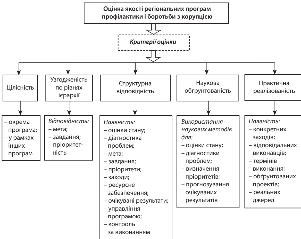
Рис. 3. Оцінка якості програм профілактики правопорушень та боротьби з корупцією [31]