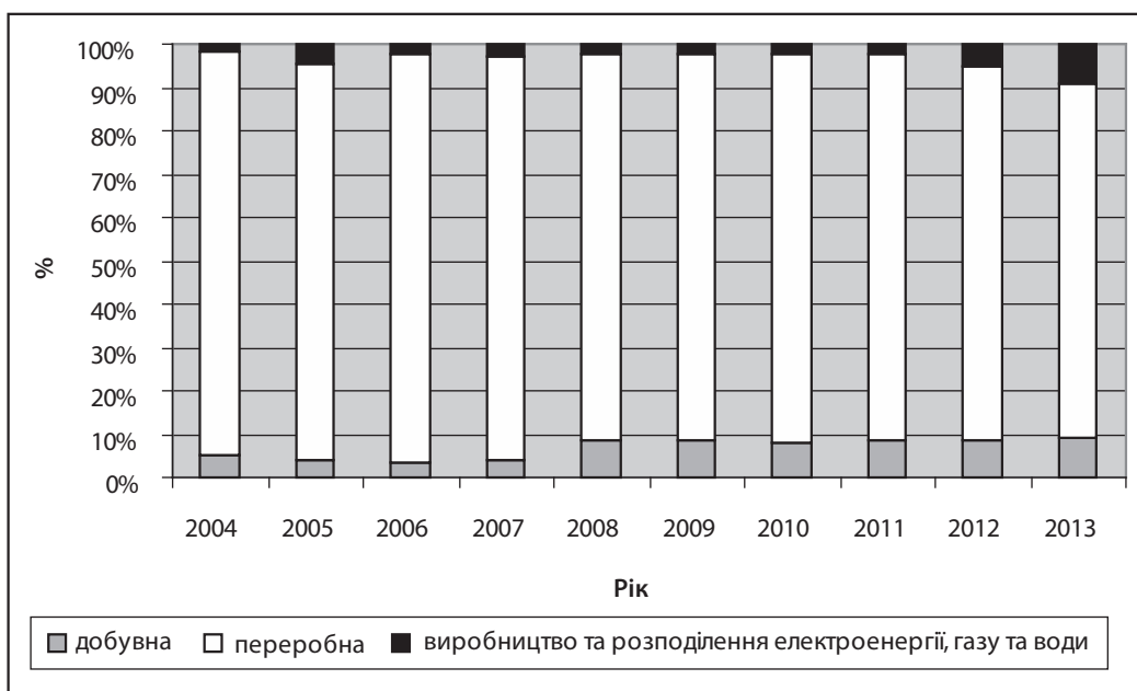
Рис. 2. Структура ПІІ за видами промисловості, %

Наявні проблеми надходження й розподілу інвестицій у промисловому секторі України полягають у структурних диспропорціях (технологічних, галузевих, регіональних, за джерелами інвестування), що загрожують поглибленням дисбалансів товарних і фінансових ринків, консервацією неефективної структури виробництва, монополізацією окремих стратегічно важливих або соціально значущих галузей економіки, нерациональним використанням сировинно-ресурсної бази та виробничих потужностей. Розглянемо основні причини недостатнього іноземного інвестування у промисловість.