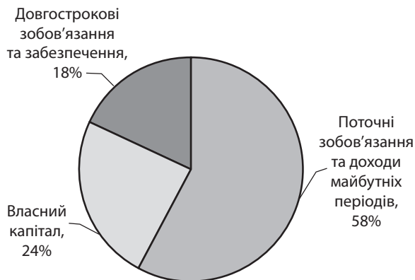
Рис. 1. Структура капіталу підприємств галузі на кінець 2011 р.

власного капіталу) залишається хоча на стабільному, але недостатньо високому рівні. Це вказує на наявність потенційних значних резервів нарощення власного капіталу. Оцінку динаміки джерел формування власного капіталу галузі представлено в табл. 2 .