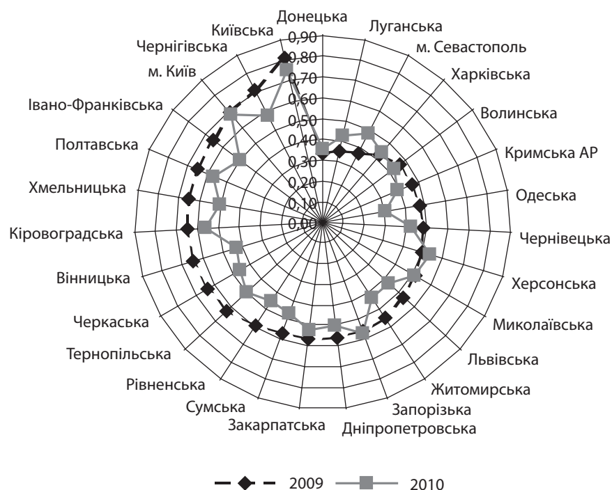
Рис. 2. Диференціація регіонів України за рівнем комфортності проживання

високий границею було прийнято значення середнього інтегрального показника на рівні 0,6, тобто якщо середній інтегральний показник має значення менше 0,6, такі регіони вважаються з низьким рівнем комфортності проживання населення, і навпаки, високий рівень проживання визначається, якщо інтегральний показник дорівнює або більше 0,6. Дані свідчать про те, що середній рівень комфортності проживання лише в м. Київ у 2009 – 2010 рр. був на високому рівні та зазнав незначної зміни в бік зменшення. Покращився показник комфортності проживання у областях: Донецька, Луганська, м. Севастополь та Херсонська, при цьому такі регіони, як Харківська, Миколаївська та Запорізька області мали низькі значення аналізованого показника та зазнали незначних змін. Незважаючи на те, що Кіровоградська, Полтавська, Чернігівська, Київська області мали високі показники комфортності проживання, вони зменшилися за аналізований період. Усі останні регіони потребують більш пильної уваги щодо показників комфортності проживання, бо їхні показники, знаходячись на низькому рівні, зменшилися впродовж аналізованого періоду.