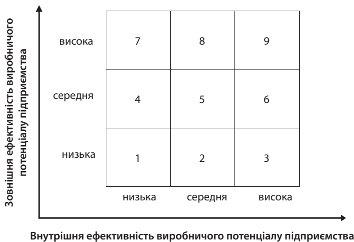
Рис. 1. Узагальнена матриця стратегій управління ефективністю виробничого потенціалу підприємства

інвестування в формування ефективного виробничого потенціалу; стабільного функціонування – паритету й інвестування у розвиток ефективного виробничого потенціалу; прогресивного розвитку і позитивного зростання – лідерства й переважного інвестування. Матрицю стратегій можна поділити на три зони за пропозиціями Ястремської О. М. [12], наповнивши їх змістом щодо стратегій ефективності виробничого потенціалу: