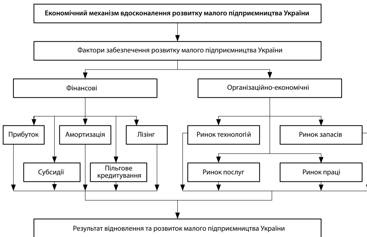
Рис. 2. Економічний механізм відновлення та розвитку малого підприємництва України