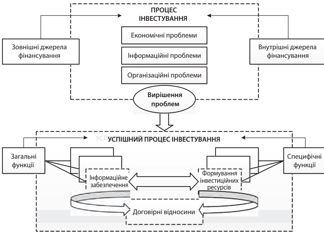
Рис. 3. Проблеми процесу інвестування та можливий напрям їх розв'язання

стосунків та удосконаленими договірними умовами з іноземними товаровиробниками завдяки володінню актуальною інформацією про вигідні можливості.