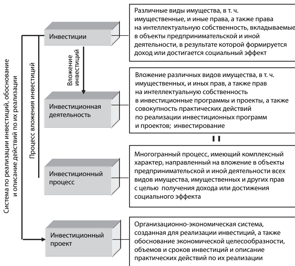
Рис. 2. Взаимосвязь основных понятий

Анализ определений инвестиционной деятельности и инвестиционного процесса, представленных в литературе и выведенных в данной работе, позволяет нам сделать вывод о том, что, несмотря на разные подходы к исследуемой проблеме, данные термины определяют одно и то же. Понятия «деятельность» и «процесс», безусловно, не являются синонимами, но, когда мы говорим об инвестиционной деятельности, мы понимаем