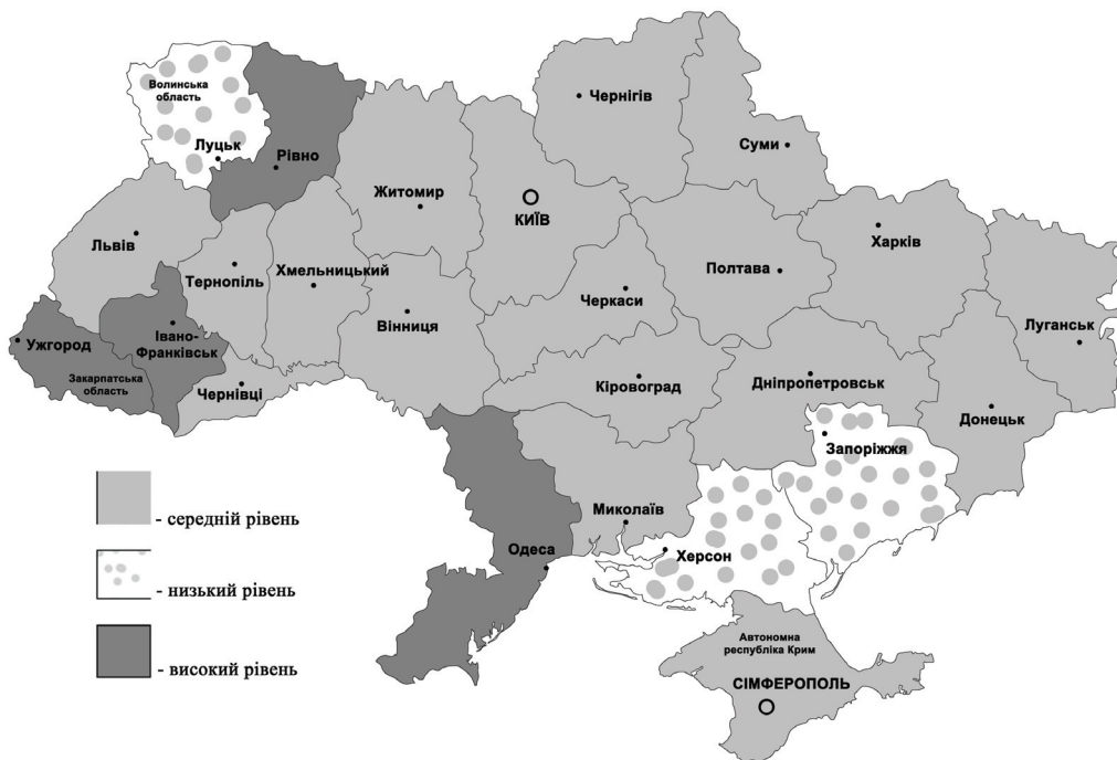
Рис. 1. Результати оцінки стану регіонів за показниками руху і використання робочої сили

Втрати робочого часу, які можуть призвести до зменшення обсягів виробництва продукції зменшилися