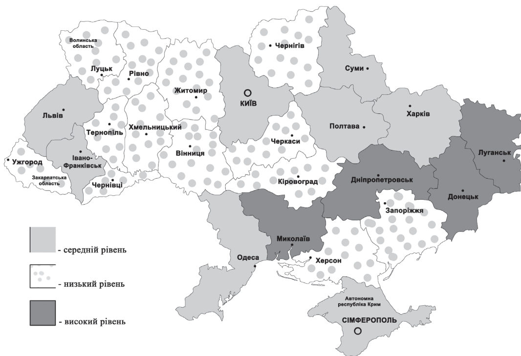
Рис. 5. Результати оцінки стану регіонів за показниками витрат на професійний розвиток і соціально-культурне забезпечення

Більшість керівників сьогодні розуміють переважну цінність трудових ресурсів у порівнянні з іншими, тому прагнуть створити найсприятливіші умови праці для своїх працівників. Щоб наймані працівники не прагнули змінити місце роботи, роботодавці не лише турбуються про безпечний та комфортний виробничий процес, а й надають своїм працівникам так званий соціальний пакет. Це, як правило, допомога у вирішенні побутових проблем за рахунок роботодавця, забезпечення житлом, турбота про здоров'я, культурний розвиток, відпочинок, забезпечену старість (т. б. недержавне пенсійне страхування за рахунок роботодавця) своїх працівників.