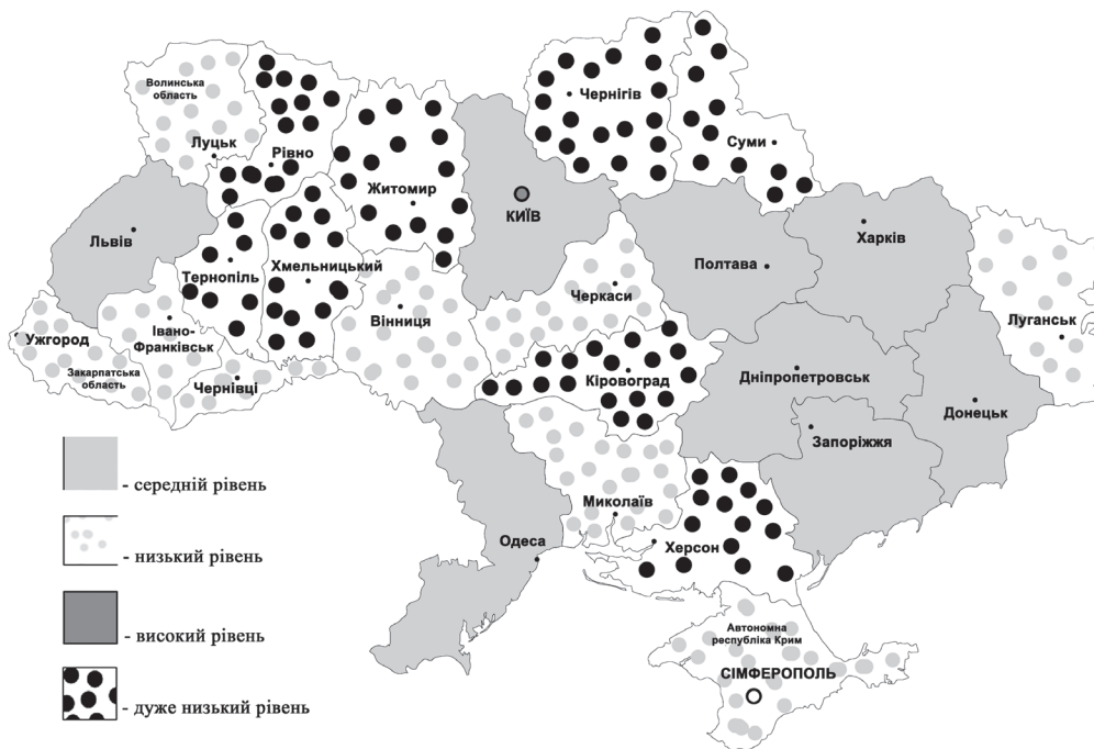
Рис. 3. Результати оцінки стану регіонів за показниками рівня оплати праці

Результати розрахунків інтегральних показників витрат на професійний розвиток і соціально-культурне забезпечення відображено на рис. 5 .