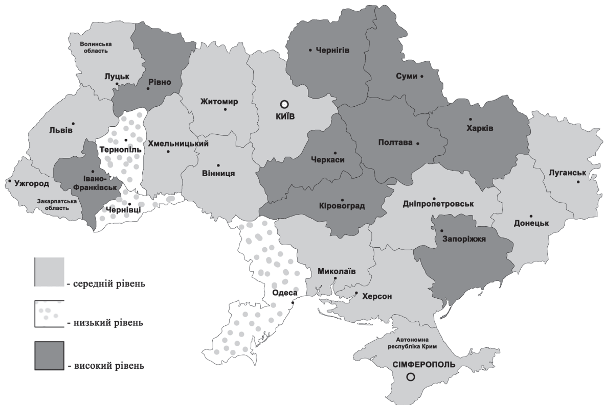
Рис. 6. Результати оцінки стану регіонів за показниками стану умов праці та соціального захисту найманих працівників

ням регіональних і галузевих особливостей функціонування підприємств; створення дієвої системи моніторингу і звітності; розробка і впровадження соціальних програм з врахуванням особливостей розвитку регіону (професійної підготовки, охорони здоров'я, умовами праці тощо); розробка та реалізація механізмів закріплення молодих кадрів на робочих місцях регіону, що включали б гідні умови й оплату праці, формування соціальної інфраструктури тощо; поширення принципів соціально-відповідально бізнесу в українській бізнес-спільноті; створення формальних – сумісних органів управління (ради, комісії тощо), які об'єднують суб'єктів ВНЗ, представників влади, роботодавців і громадських структур; застосування програмно-цільового підходу до розвитку найманих працівників засобами соціально партнерства. ■