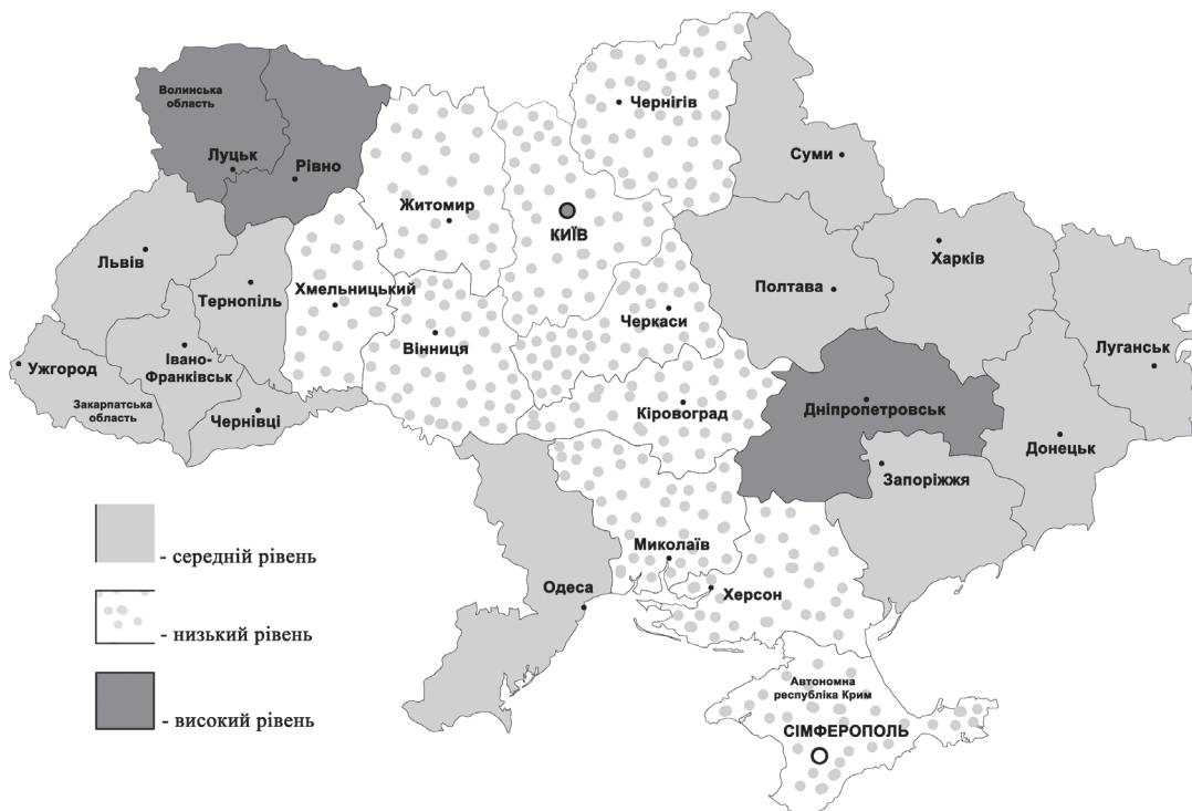
Рис. 2. Результати оцінки стану регіонів за показниками якісного складу найманих працівників

Результати розрахунків інтегральних показників якісного складу працюючих відображено на рис. 2.