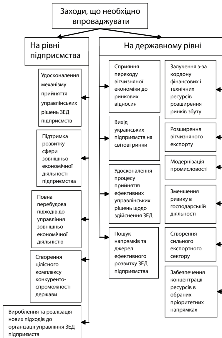
Рис. 2. Заходи щодо вдосконалення управління ЗЕД вітчизняних промислових підприємств